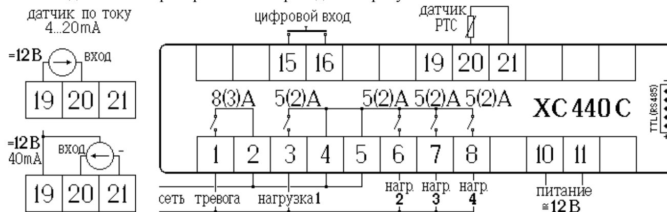
Схема подключения прибора XC440C приведена на рисунке:

Схемы подключения приборов XC440D и XC460D приведены на корпусах приборов.